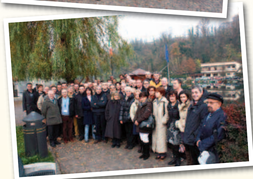
Alcune immagini del 5° Congresso Provinciale (Imbersago, 21 novembre 2009)